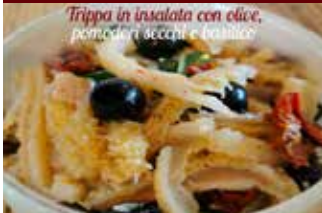
Trippa in insalata con olive, pomodori secchi e basilico